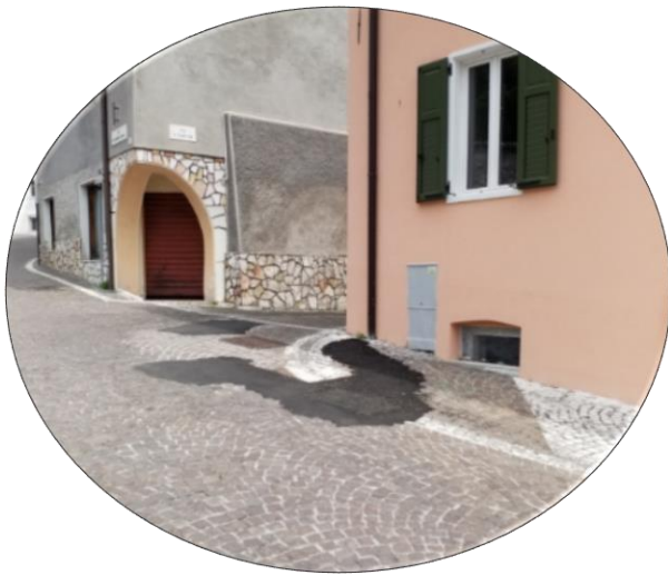
Collegamento a pozzetti SET Distribuzione per riutilizzo tubazioni che entrano in casa

Se la connessione richiesta è quella FWA il tecnico Open Fiber cercherà la posizione migliore sulla casa del cittadino che ha fatto richiesta per installare un'antennina per ricevere il segnale wireless.