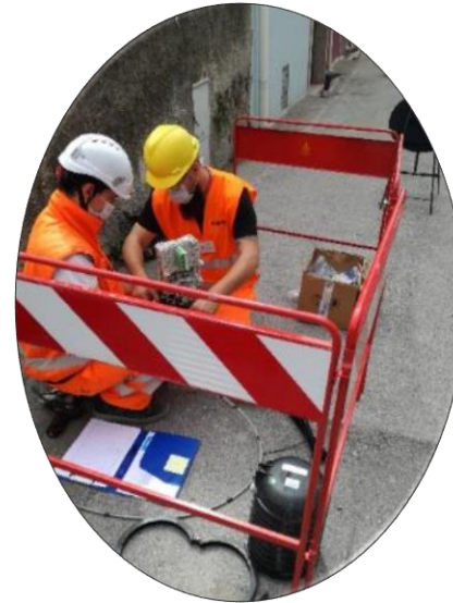
I nostri tecnici mentre giungano il cavo in fibra ottica per portarlo in casa