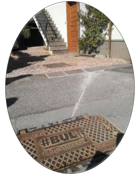
Esempio di scavo su proprietà pubblica e collegamento ad infrastruttura del privato