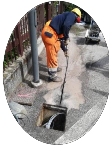
I nostri tecnici impegnati in uno scavo in tecnica di microtrincea